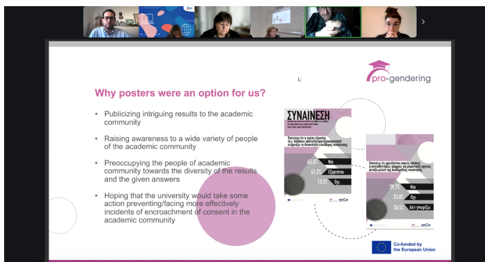
Abbildung 1: Internationale Online-Multiplikatorenveranstaltung, 04. November 2025

Ein Höhepunkt des Workshops war die Präsentation kleiner studentischer Projekte , die von Partneruniversitäten entwickelt wurden. Diese Projekte zeigten praktische Initiativen zur Förderung von Inklusion und Gleichstellung in akademischen Gemeinschaften. Der Workshop bot eine einmalige Gelegenheit, von Gleichgesinnten zu lernen, Herausforderungen und Erfolge zu diskutieren und umsetzbare Wege zu erforschen, um Hochschulen geschlechtergerechter und inklusiver zu gestalten.